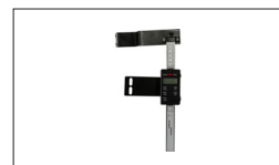
Réf : 723552 Afficheur Numérique