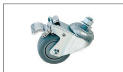
Réf : 98-0130 Jeu de 4 Roulettes pour socle ouvert